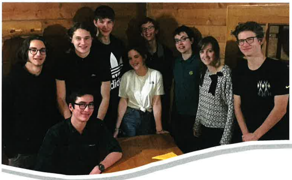
Réception des jeunes nés en 1999