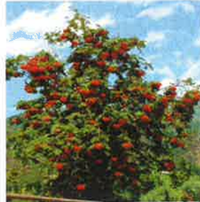
Sorbier des oiseaux, alisier blanc, sorbier domestique, alisier de Suède