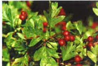
Aubépine épineuse, Aubépine rignonensis