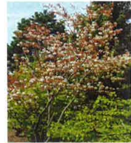
Amélanchier à feuilles ovales