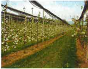
Pommier et pommier d'ornement