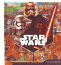
Livre - jeu

LUCAS, G.. Star Wars, cherche et trouve.