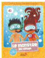
Pour les 6 - 9 ans