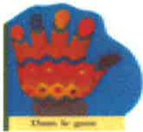
Pour les petites mains

SCHREIER, J.. La face cachée de Margot. DVD