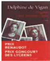
Prix des lycéens

VIGAN, D. de D'après une histoire vraie.