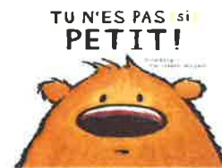
Album pour petits et grands

Une Expo sur les couleurs 30 volumes à votre disposition