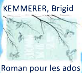
KEMMERER, Brigid Roman pour les ados