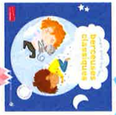
GAMBINI, Cécile Berceuses classiques

Mes plus belles berceuses et autres musiques douces pour les petits