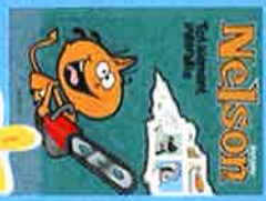
BERTSCHY Bande dessinée