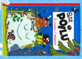
BAILLY, Pierre Collection Petit poilu

Mes plus belles berceuses et autres musiques douces pour les petits