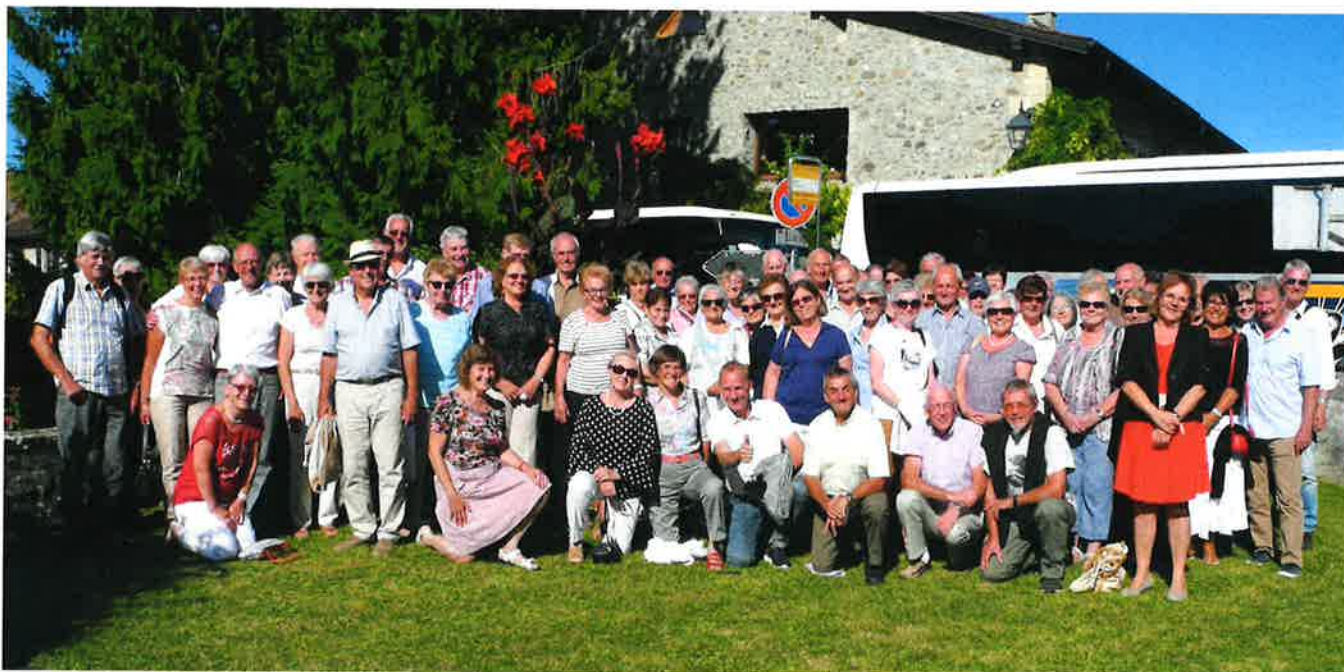
Sortie des aînés